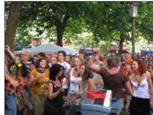
Wer sitzenblieb, war selber schuld ...