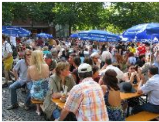
Noch ein Blick auf den vollbesetzten Rotkreuzplatz.