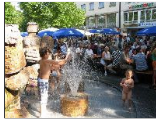
Geregnet hat es beim Neuhauser Woodstock-Konzert (im Gegensatz zum Original) zum Glück nicht.

Erfrischen konnte man sich trotzdem: am Brunnen und (mit etwas Geduld) an den Getränkeständen.