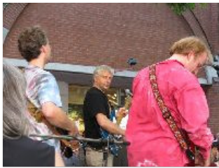
Der Schauspieler, Regisseur und Drehbuchautor Udo Wachtveitl (Mitte) überzeugte beim Rock-Klassiker „Wild Thing“ mit seinen Gesangs- und Gitarrenkünsten.