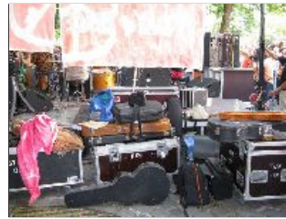
"Backstage" beim Woodstock-Konzert in Neuhausen.